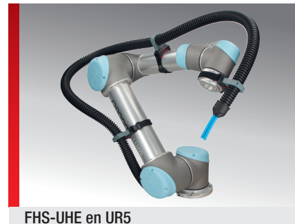
FHS-UHE en UR5