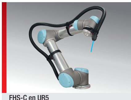
FHS-C en UR5